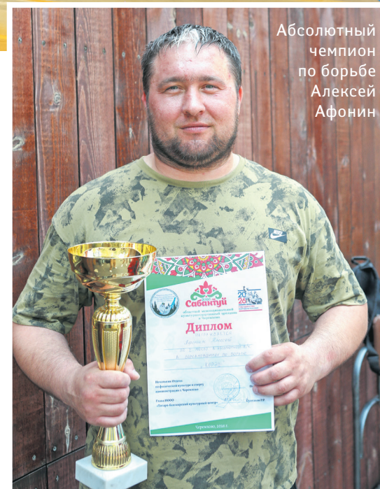
Абсолютный чемпион по борьбе Алексей Афонин

В парке раскинулась ярмарка народных мастеров. Изделия из бересты, украшения и аксессуары в технике мокрого валяния: головные уборы, кошельки, чехлы для телефонов – чего тут только не было. Среди всего этого великолепия обращал на себя внимание стол семейного творческого объединения «Развивашка по-татарски».