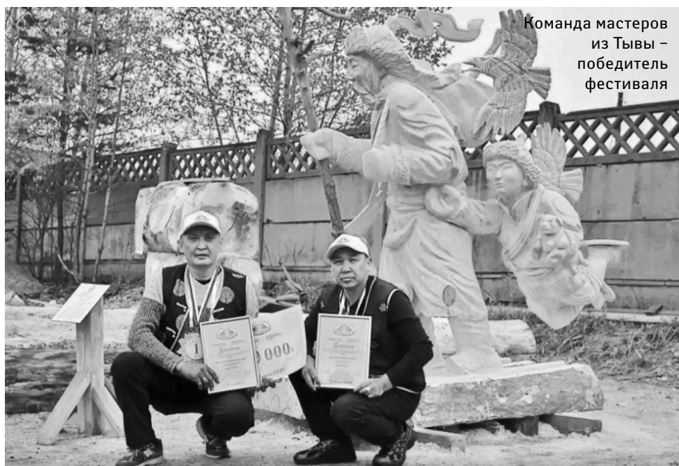
Команда мастеров из Тывы – победитель фестиваля