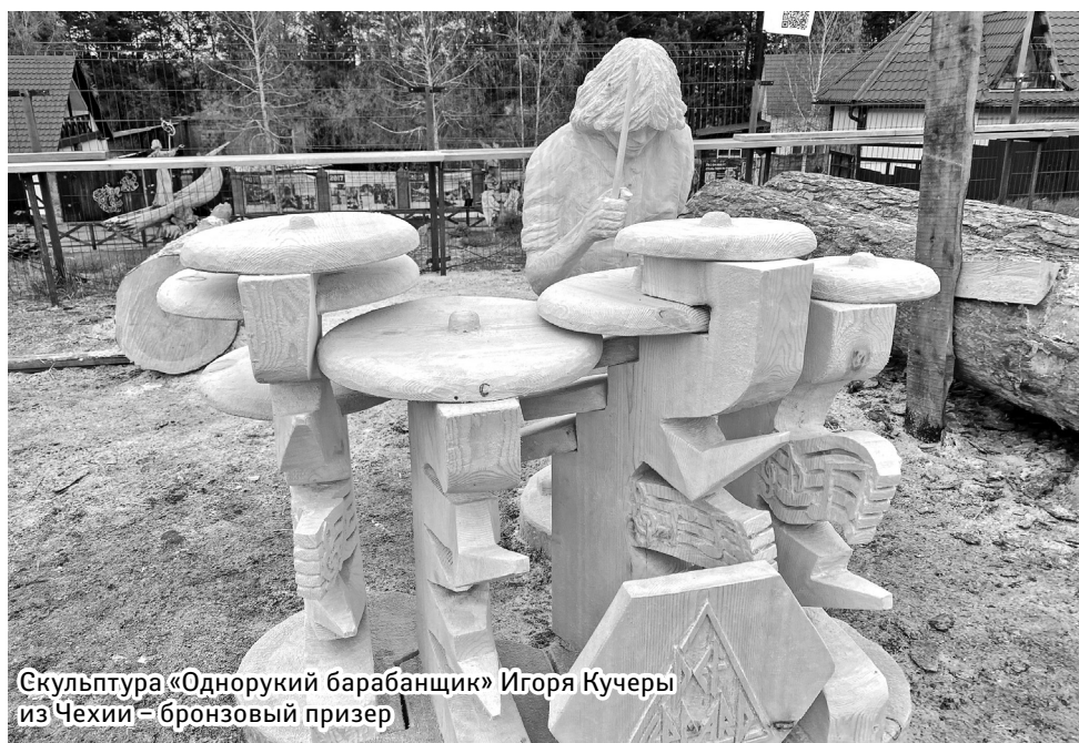
Скульптура «Однорукий барабанщик» Игоря Кучеры из Чехии – бронзовый призер