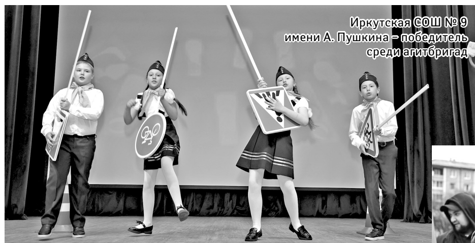
Иркутская СОШ № 9 имени А. Пушкина – победитель среди агитбригад

Помимо выявления чемпионов и призеров миссия конкурса – повышать общий уровень дорожной грамотности у школьников. Незнание, тем более несоблюдение правил дорожного движения, может стоить здоровья, а иногда и жизни.