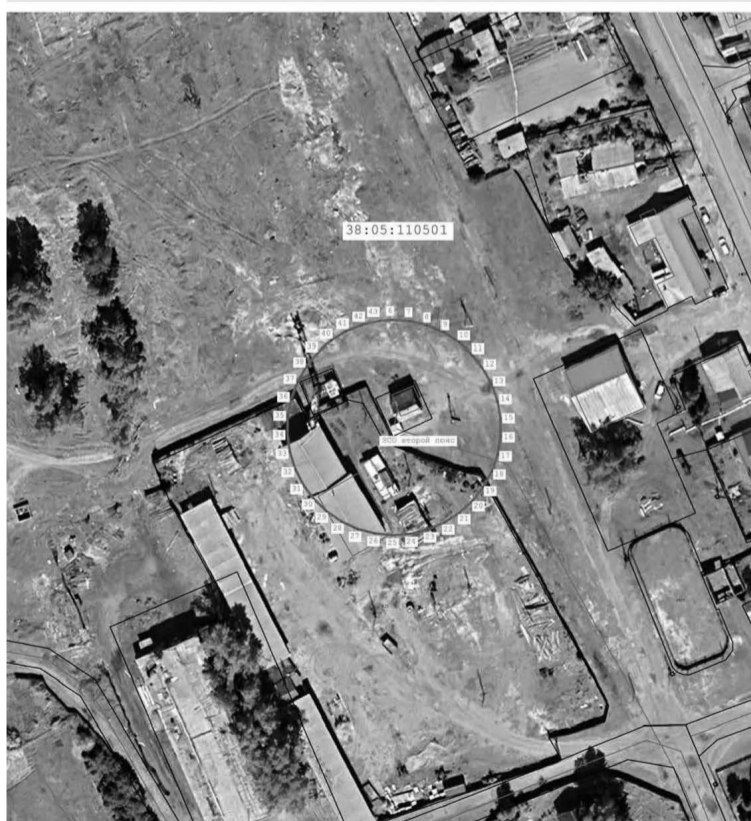
Масштаб 1:1 250