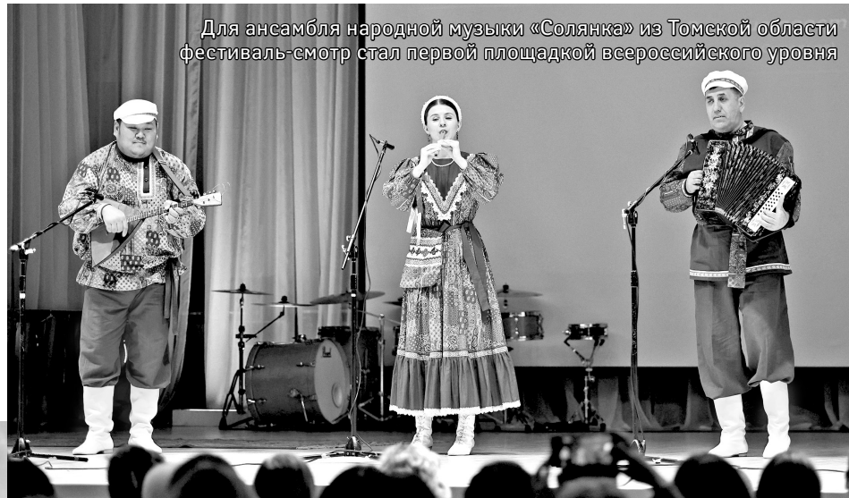
Для ансамбля народной музыки «Солянка» из Томской области фестиваль-смотр стал первой площадкой всероссийского уровня

От Байкальских берегов до Тихого океана: в Иркутске состоялся первый всероссийский фестиваль-смотр национальных музыкальных инструментов народов России, прозвучали уникальные мелодии.