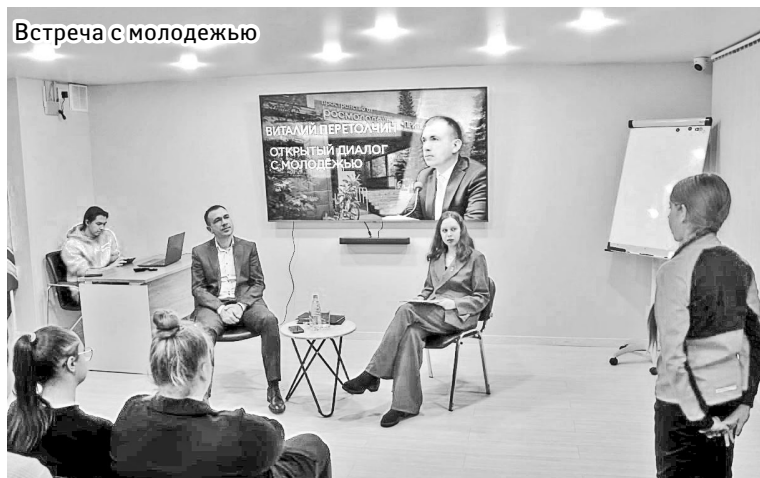
Встреча с молодежью