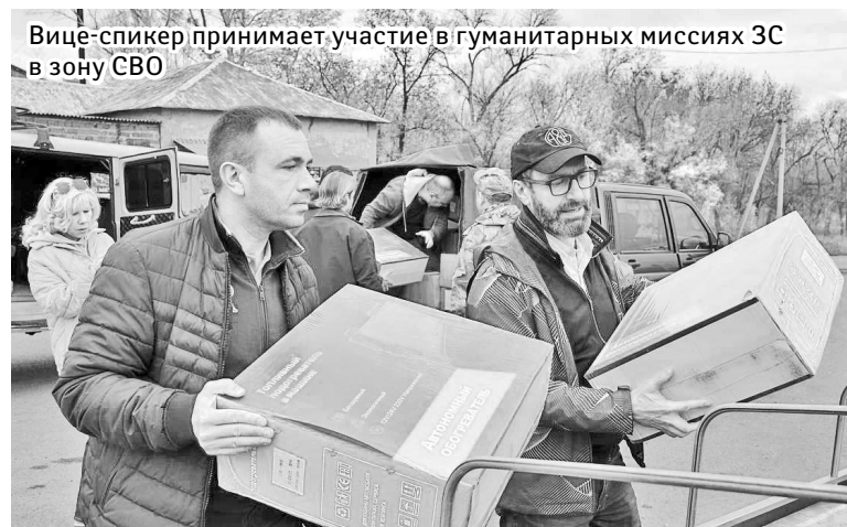
Вице-спикер принимает участие в гуманитарных миссиях ЗС в зону СВО