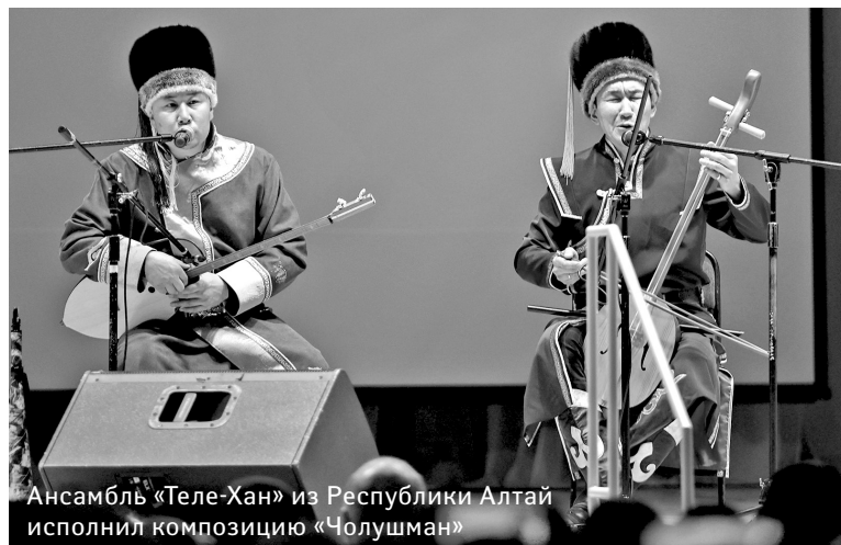
Ансамбль «Теле-Хан» из Республики Алтай исполнил композицию «Чолушман»

Мария СЛЕПЦОВА