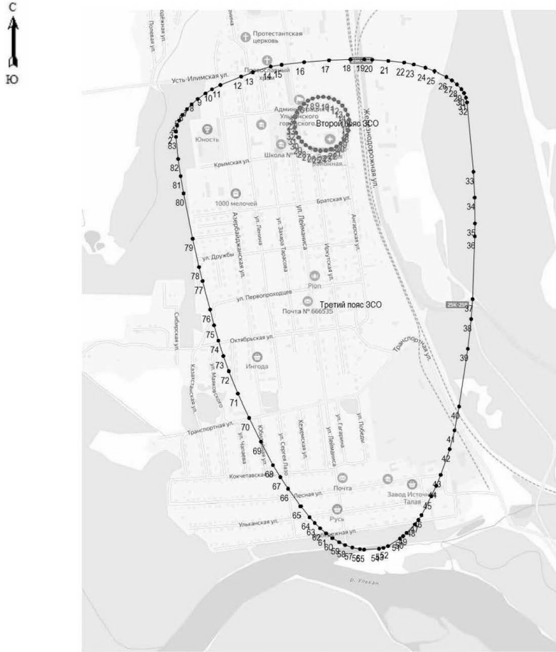
План границ объекта

Обозначения земельных участков, размеры которых могут быть переданы в масштабе разделов графической части: