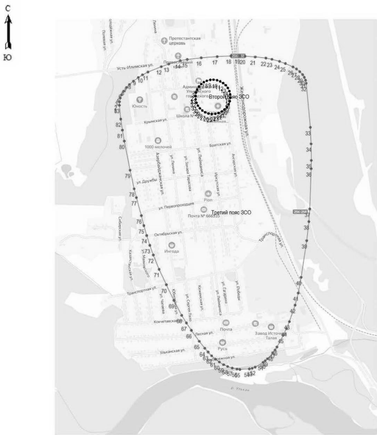
Масштаб 1 : 25000

Используемые условные знаки и обозначения: