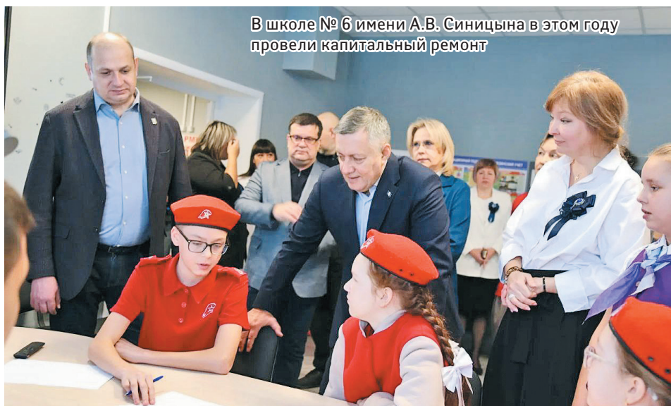
В школе №6 имени А.В. Сеницына в этом году провели капитальный ремонт

– Модернизация библиотеки прошла по нацпроекту «Семья». К тому же здесь сделан капитальный ремонт. Находясь в городе, конечно, захотел оценить результат проделанной работы.