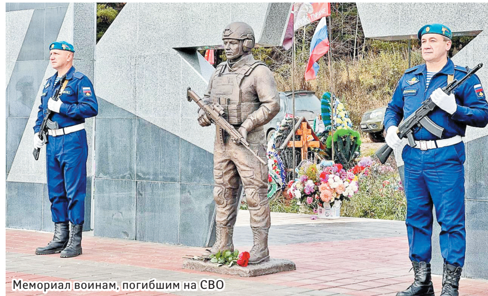
Мемориал воинам, погибшим на СВО