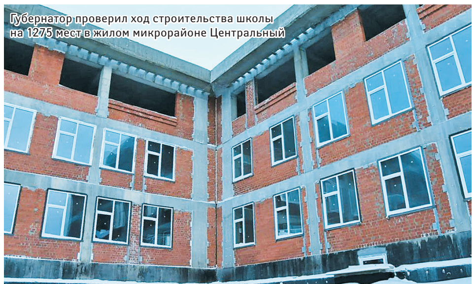
Губернатор проверил ход строительства школы на 1275 мест в жилом микрорайоне Центральный