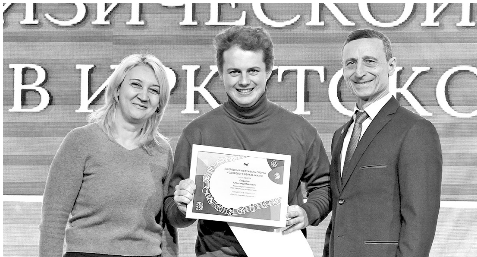
Корреспонденты Медиа-центра «Приангарье» стали лучшими спортивными журналистами и фотографами года

Также на церемонии отметили лучшие спортивные федерации, спортшколы, вузы и учреждения СПО, студенческие и школьные спортивные клубы, муниципалитеты, лучших спортивных журналистов и фотографов.