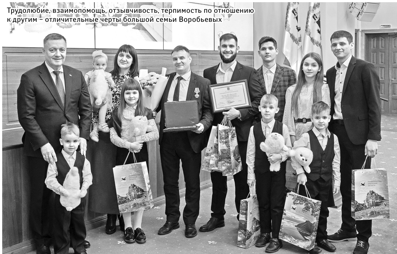
Усадьба Воробьевых победила в областном конкурсе на лучшую семейную усадьбу

Трудолюбие, взаимопомощь, отзывчивость, терпимость по отношению к другим – отличительные черты большой семьи Воробьевых