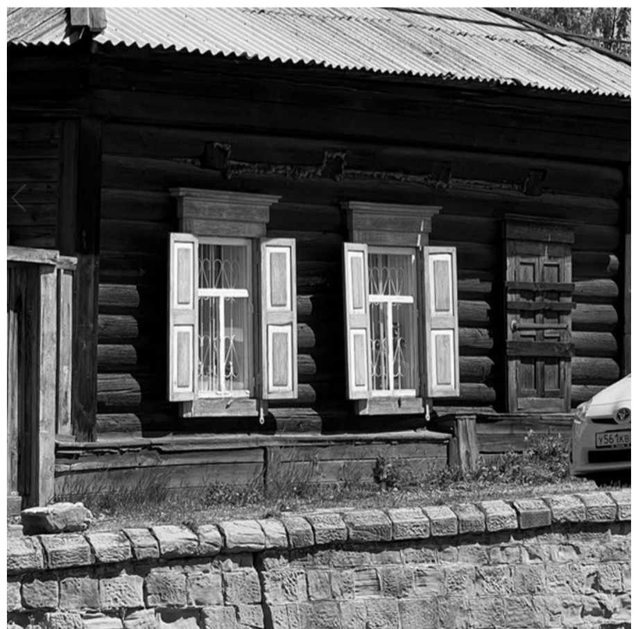
Фотография № 2. Вид на фрагмент фасада объекта культурного наследия