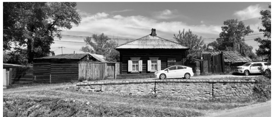
Фотография № 1. Вид на объект культурного наследия