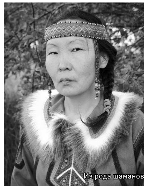
Из рода шаманов