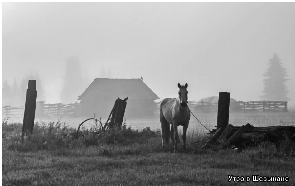
Утро в Шевыкане