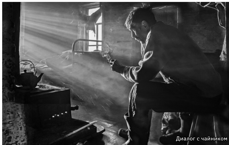
Диалог с чайником