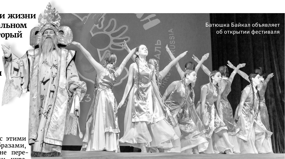
Батюшка Байкал объявляет об открытии фестиваля