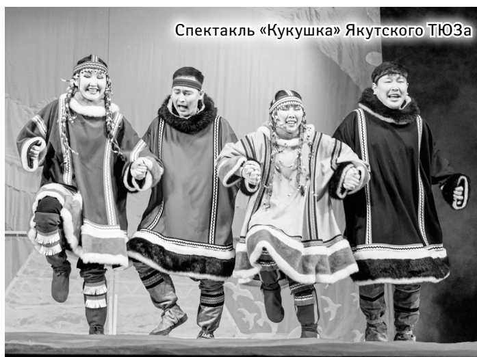
Спектакль «Кукушка» Якутского ТЮЗа