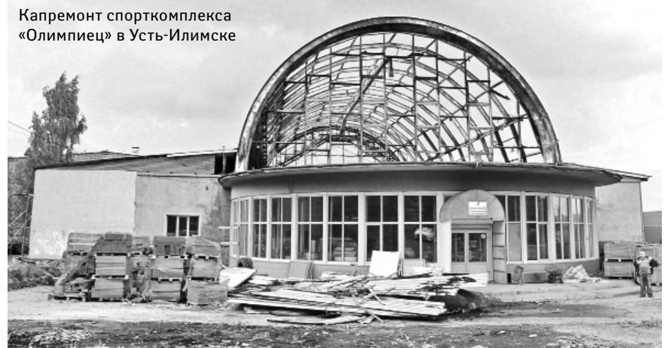
Капремонт спорткомплекса «Олимпиец» в Усть-Илимске

■ ТЕРРИТОРИИ С наступлением лета парламентская работа не останавливается. Депутаты Заксобрании области больше времени проводят в избирательных округах, осуществляют контроль за ремонтом или строительством социальных объектов, оказывают помощь участникам СВО и их семьям, занимаются патриотическим воспитанием молодежи.