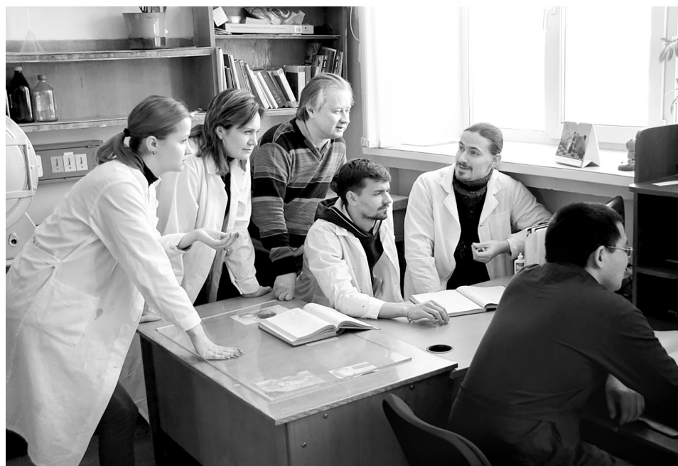
Молодые ученые в лаборатории халькогенорганических соединений

■ НАУКА Стрессы, заболевания, плохая экология – все это сильно бьет по организму человека. Если не задумываться о здоровье, то тяжелых последствий не избежать. На помощь приходят новые исследования. В Иркутском институте химии им. А.Е. Фаворского СО РАН нашли соединение, которое в будущем может помочь в лечении и профилактике инсульта головного мозга, инфаркта миокарда, сердечно-сосудистых и раковых заболеваний, а также диабета, артрита, болезней Альцгеймера и Паркинсона.