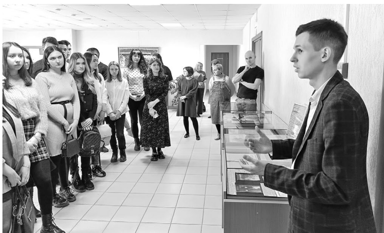
Выставка атрибутов Иркутского областного суда