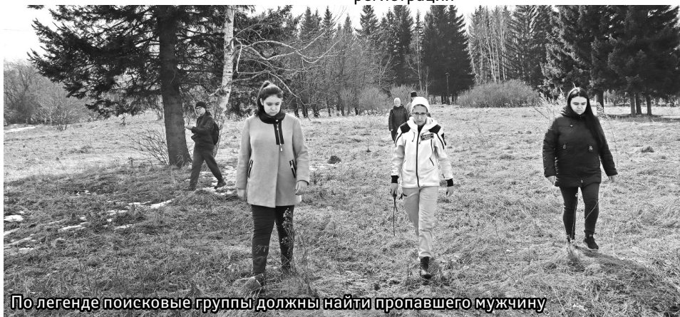
По легенде поисковые группы должны найти пропавшего мужчину