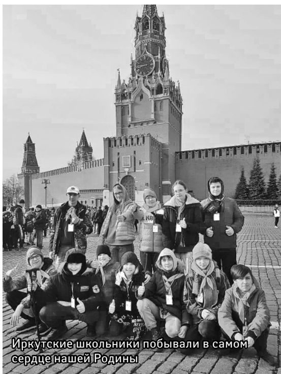
Иркутские школьники побывали в самом сердце нашей Родины

в агитпоезде. Поездка была и насыщенная, и веселая. Москва-красавица встретила нас на отлично, это были два незабываемых дня восторга, радости и открытий! А Казань просто очаровала нас, и мы хотим побывать там еще раз. Это классная возможность познакомиться ребят с нашей страной и столицей, да и просто подружиться.