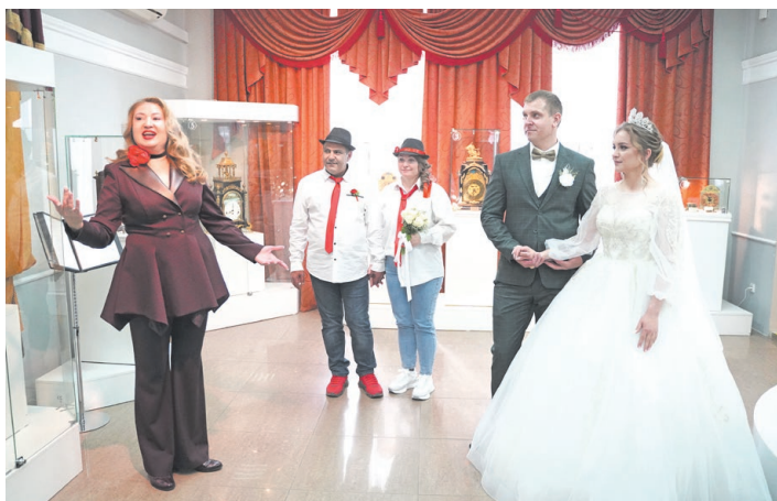
Сотрудники Музея часов подготовили интересную программу