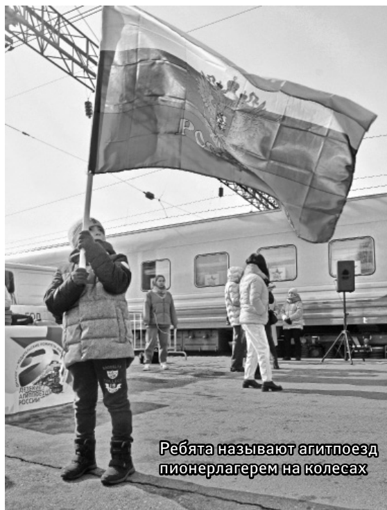
Ребята называют агитпоезд пионерлагерем на колесах