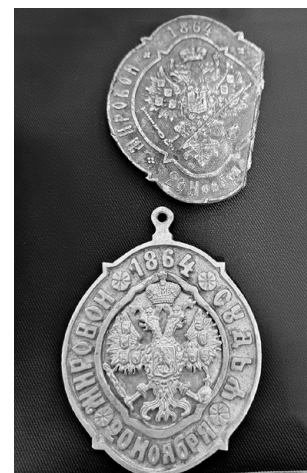
Знаки мировых судей