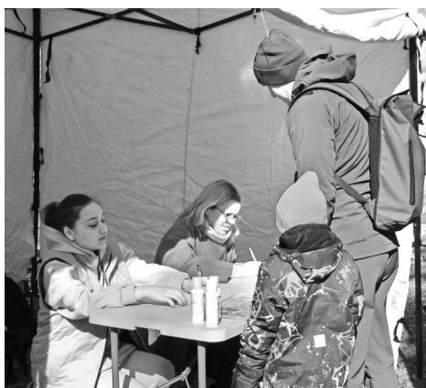
Перед началом поиска обязательна регистрация