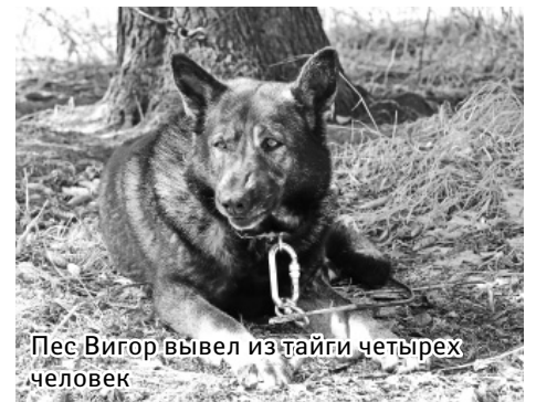
Пес Вигор вывел из тайги четырех человек