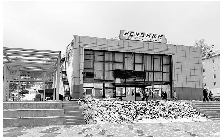
Благоустройство городского центра «Речники», ставшего победителем V Всероссийского конкурса лучших проектов создания комфортной городской среды