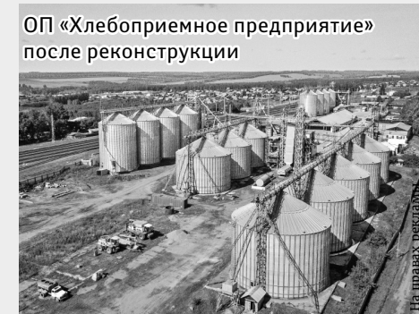
ОП «Хлебоприемное предприятие» после реконструкции

улучшить условия труда персонала, минимизировать потери. В рамках программы модернизации предприятия в соответствии с мировыми стандартами предприятие закончило переоснащение системами венти-