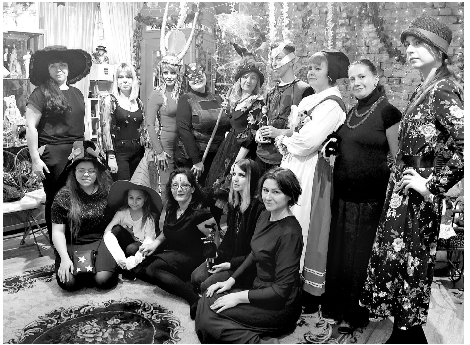
На кукловстречах незнакомые люди быстро становятся практически родственниками

■ ХОББИ Искренняя любовь к куклам характерна не только для маленьких девочек. Многие взрослые находят в давно забытом увлечении отдушину в рутине жизни, состоящей из обязанностей. Купить малышку, сшить или связать для нее одежду, сделать новый макияж, прическу, парик, переставить глазки и реснички, вывезти на природу для фотосессии – эти невинные чудачества вызывают массу положительных эмоций. Хорошо если при этом семья не крутит пальцем у виска, мол, ты бабушка, тебе о внуках да помидорах думать надо. Найти единомышленников хотя бы в интернете – уже удача, встретиться с ними – счастье. На встречах незнакомые «кукломамы» и «куклопапы» быстро становятся практически родственниками, особенно если объект увлечения – одинаковые куклы.