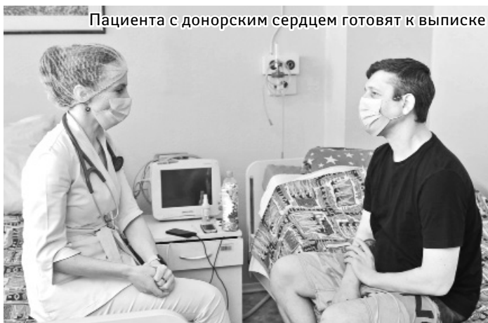
Пациента с донорским сердцем готовят к выписке