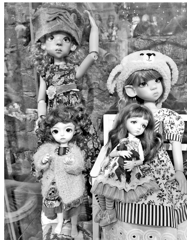
Шарнирные куклы прекрасны тем, что могут принимать любой образ