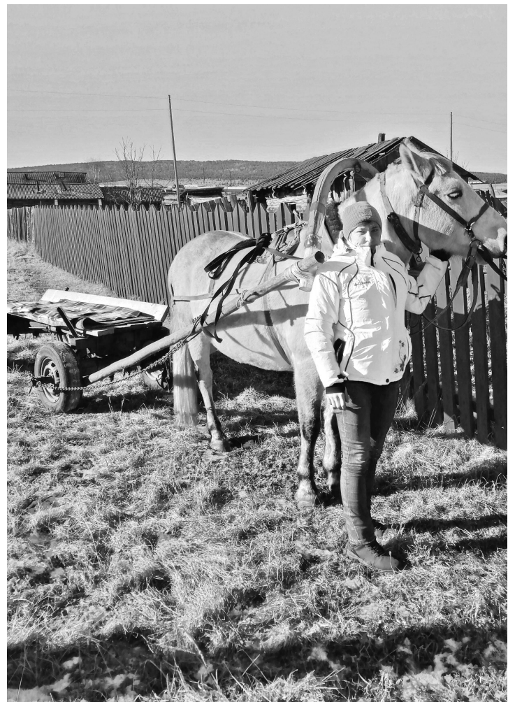
Джиган с хозяйкой