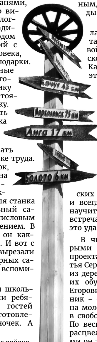
Новый символ района