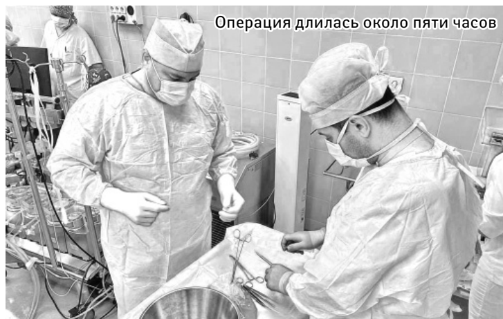
Операция длилась около пяти часов