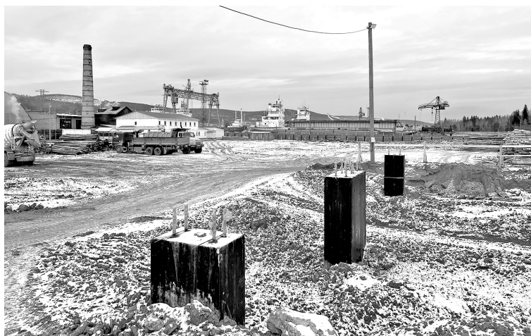
В микрорайоне Новая РЭБ строится котельная на биотопливе

Игорь Кобзев проинспектировал строительную площадку очистных сооружений. Как доложили ему, котлован глубиной более 11 м готов, в ближайшее время начнется обратная отсыпка песчано-гравийной смесью. Подрядчик планирует войти в зиму, выполнив засыпку на 5,5 м, и начать обустройство монолитного фундамента. На строительство КОСов на 2022 год предусмотре-