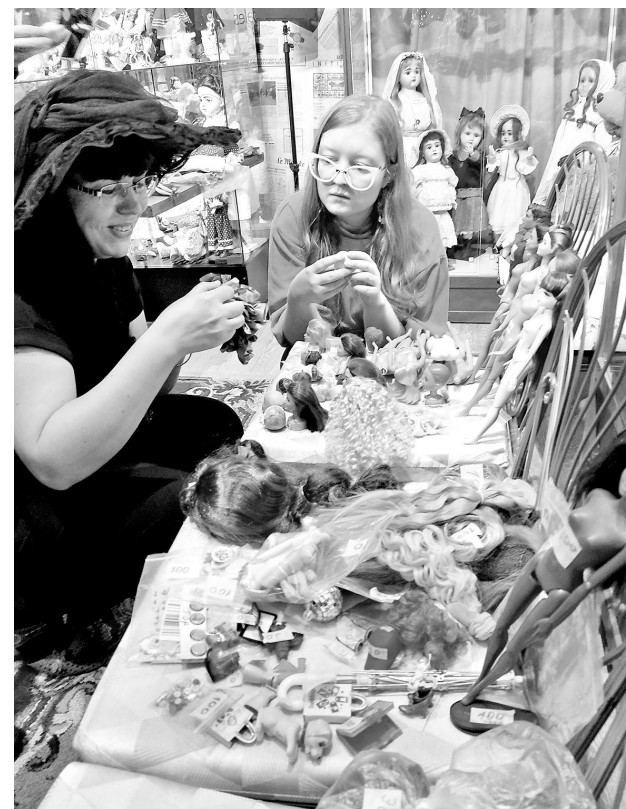
Обмен одежды, обуви, аксессуаров всегда популярен – можно найти и парик, и зонтик