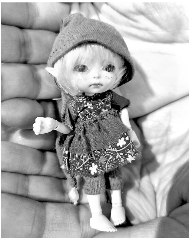
За такую малышку оригинального производителя можно отдать круглую сумму

Особенность ее в том, что продается тело с головой, а глаза, макияж, парик и одежда могут стать любимыми.