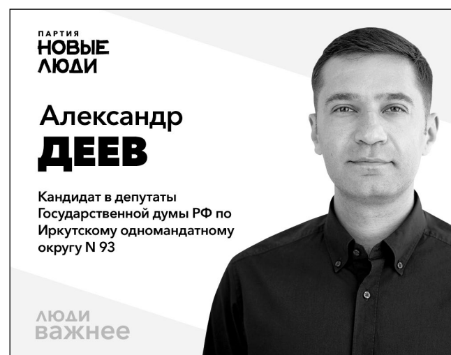
Публикация материалов осуществляется на бесплатной основе в соответствии со статьей 66 Федерального закона от 22.02.2014 г. № 20-ФЗ «О выборах депутатов Государственной думы Федерального Собрания Российской Федерации»