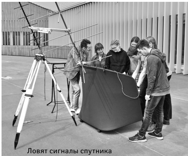
Ловят сигналы спутника

А еще журналисты учились писать научные новости, связисты – строить антенны, астрофизики – писать программы для обработки научных данных. Были и экскурсии на выставку в павильоне «Космос» ВДНХ, в музей Института космических исследований и корпорации «Энергия» и, конечно, встречи с теми, кто делает российскую космонавтику прямо сейчас.