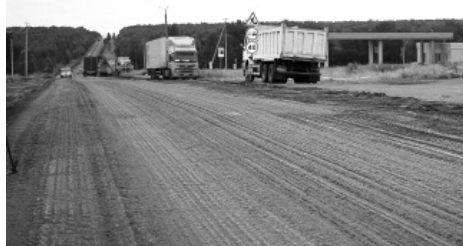
В Черемхово в 2,5 раза увеличен объем работ в рамках национального проекта «Безопасные качественные дороги»

В июле правительство РФ направило в Приангарье на дорожный ремонт 721 млн рублей. При распределении этих средств было принято решение выделить почти 100 млн рублей дополнительно в Черемхово. Это позволило в 2,5 раза увеличить объем работ, которые выполняются в рамках национального проекта «Безопасные качественные дороги». Таким образом, в городе шахтеров в этом году проведут работы на сумму 160 млн рублей.