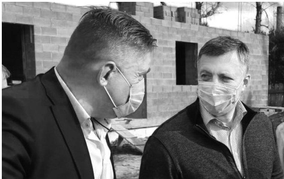
В Черемхово для детей-сирот возводят восемь жилых домов