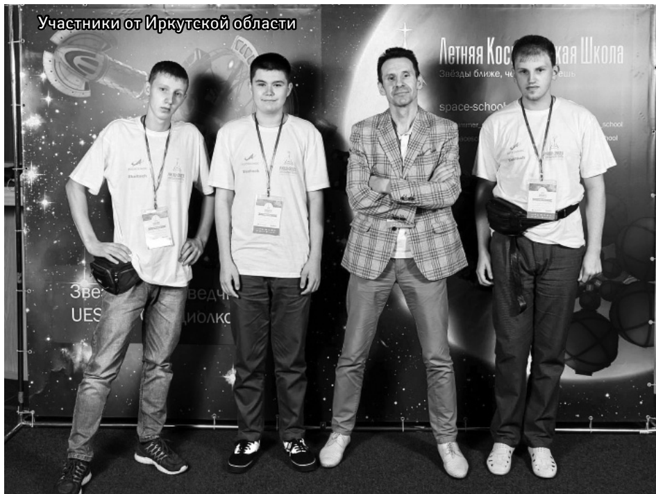
Участники от Иркутской области

Некоторые ребята из Иркутской области готовы приехать в ЛКШ еще раз, и есть основания надеяться, что к любителям астрономии из Нижнеудинского района и Иркутска присоединятся их коллеги из других городов и поселков Прибайкалья.