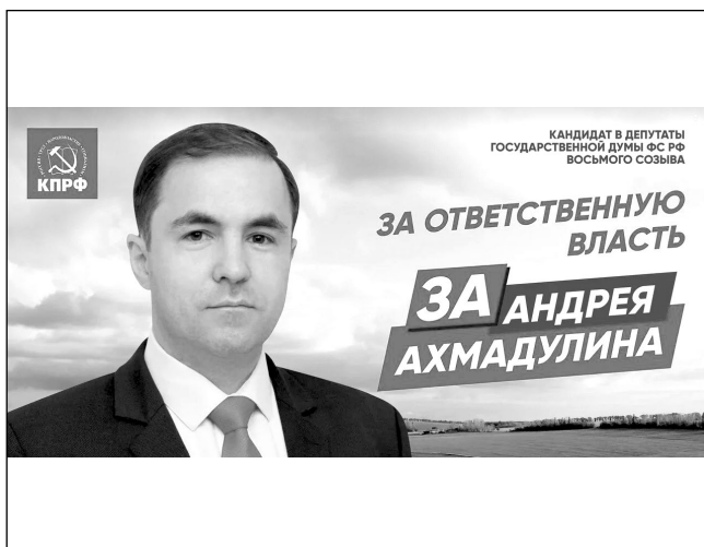
Публикация материалов осуществляется на бесплатной основе в соответствии со статьей 66 Федерального закона от 22.02.2014 г. № 20-ФЗ «О выборах депутатов Государственной думы Федерального Собрания Российской Федерации»

■ КУЛЬТУРА Около полусотни мастеров из России, стран ближнего зарубежья, Канады, Китая, Монголии покажут свое искусство на V фестивале камнерезного и ювелирного искусства «Серебряный Бабр». Событие состоится с 4 по 7 ноября в рамках Байкальского ювелирного салона в Сибэкспоцентре.