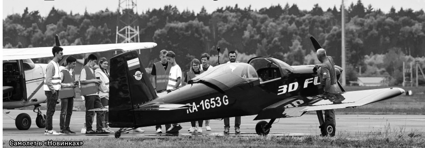
Самолет в «Новинках»

журналистам – они должны были писать о том, как проходит школа и «спасательная миссия». Я выбрал секцию «Космическая связь и дистанционное зондирование Земли», где мы принимали сигналы с настоящих космических аппаратов – Международной космической станции и метеорологического спутника NOAA-18.