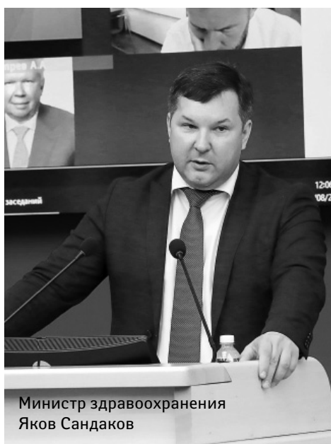
Министр здравоохранения Яков Сандаков

Министр здравоохранения региона Яков Сандаков рассказал, что в Приангарье с начала пандемии заболело коронавирусной инфекцией более 97,7 тыс. человек, умерло свыше 4,9 тыс. жителей. В последние недели в сутки в среднем выявляется 395 зараженных COVID-19. На стационарном лечении находятся порядка 2,2 тыс. человек, из них 173 – в тяжелом состоянии. В регионе постепенно сносится коечный фонд, развернутый для пациентов с коронавирусом, – в настоящее время выделено около 3,4 тыс. мест, свободны 34,8%. К оказанию плановой помощи вернулись 12 медицинских организаций области.