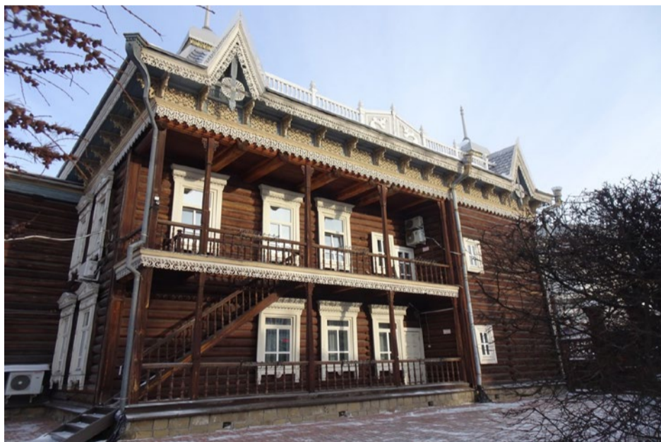
Боковой (юго-западный) фасад дома.