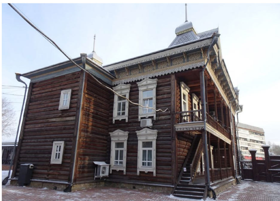
Дворовый (северо-западный) фасад дома.