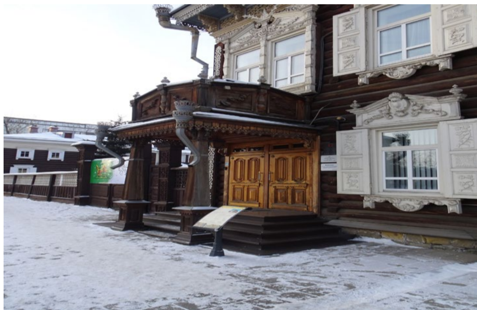
Парадное крыльцо под навесом.