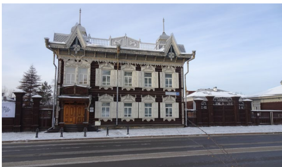
Главный (юго-восточный) фасад особняка. Вид с ул.Энгельса.

Адрес объекта культурного наследия федерального значения : Иркутская область, г. Иркутск, ул. Энгельса, 21. Наименование объект: «Дом жилой (дер.), кон. XIX в.»