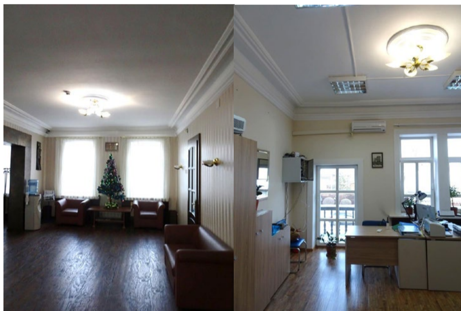
Фото 10, 11. Фрагменты интерьеров.