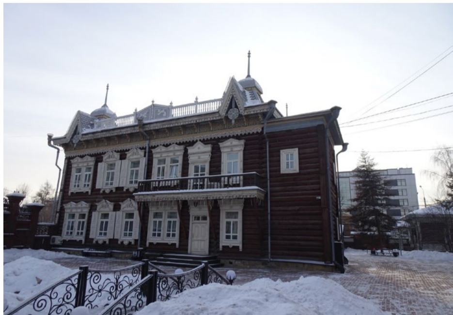
Боковой (северо-восточный) фасад дома.