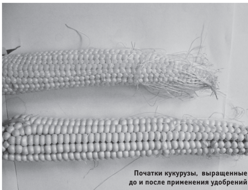
Почки кукурузы, выращенные до и после применения удобрений