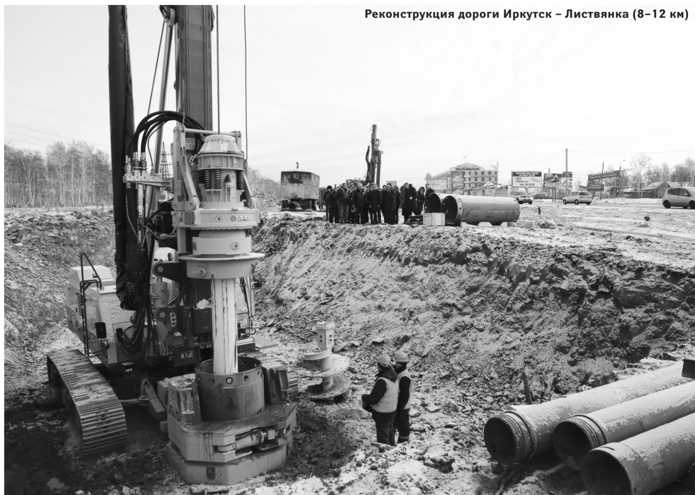
Реконструкция дороги Иркутск — Листвянка (8–12 км)

Как напомнила на конференции первый заместитель председателя правительства Иркутской области Николай Слободчиков, в 2015 году Дорожный фонд Приангарья составит около 7 млрд рублей. Он отметил, что необходимо грамотно распорядиться этими