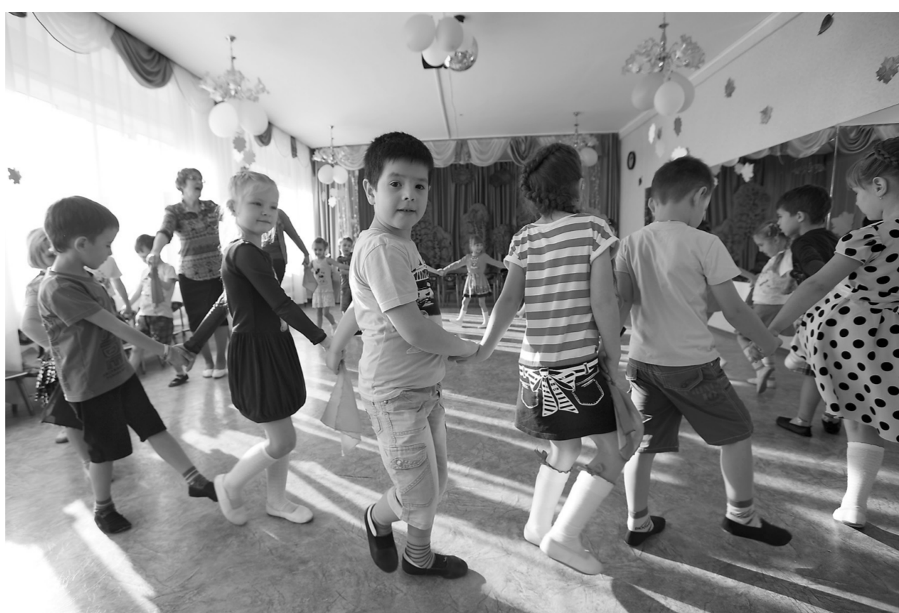
Область безукоризненно выполняет социальные обязательства по обеспечению местами в детских садах детей от трех до семи лет

Также министр рассказал, что в регионе проводится ремонт в 67 медицинских учреждениях, из них на 27 объектах — капитальный. Завершен капремонт в санатории Нагальск Баяндаевского района, Братском психоневрологическом диспансере и стационаре Черемховского филиала Иркутского