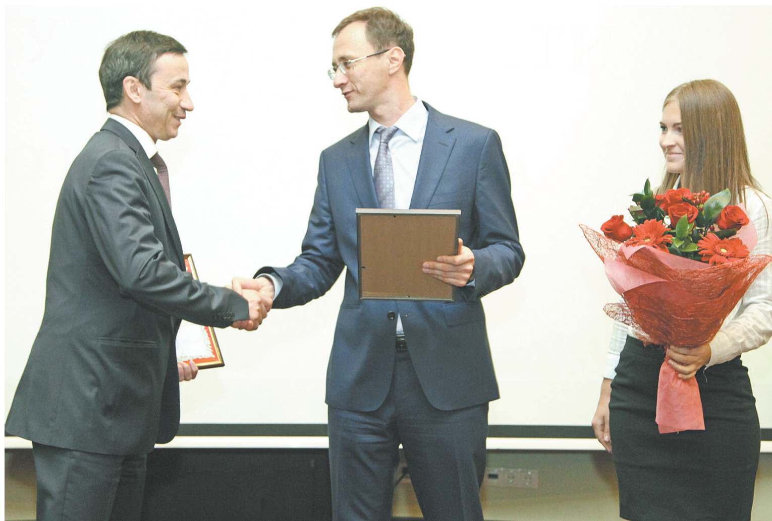
Награждение победителя рейтинга хозяйствующих субъектов — компании АНХК

По окончании церемонии состоялась дискуссия по вопросам взаимодействия бизнеса и власти с участием министров областного правительства. Представители компаний поднимали самые различные проблемы, говорили о необходимости