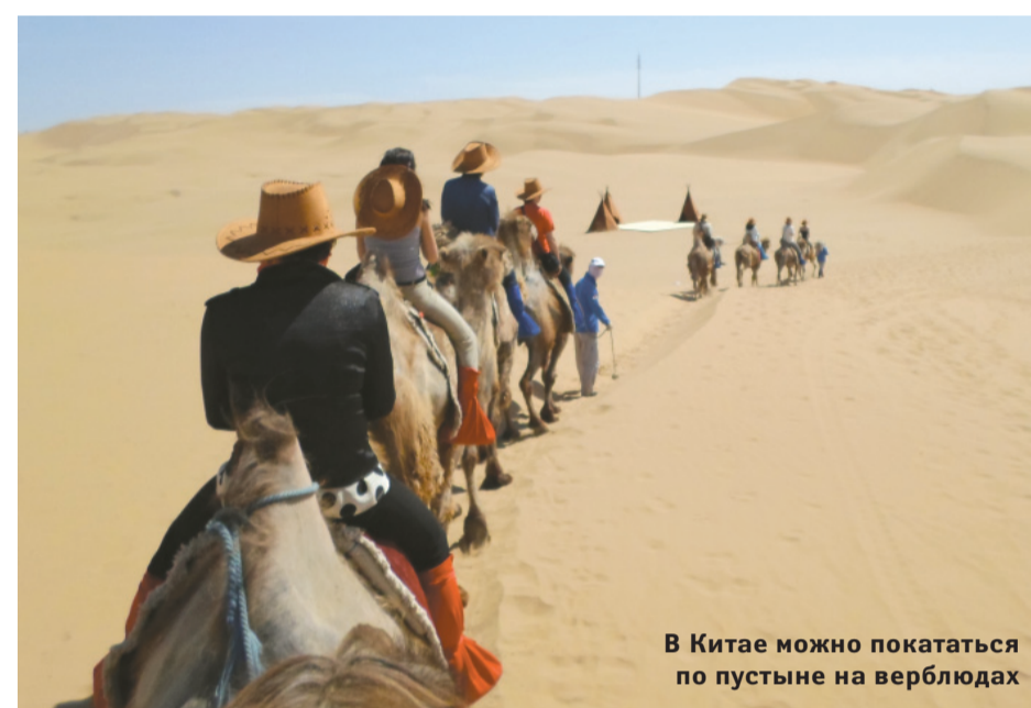
В Китае можно покататься по пустыне на верблюдах

журналистов довез специальный автобус. Дорога вывела между крутыми возвышенностями, за окном мелькали водопады и захватывающие дух пропасти. По словам гида, Тайшань считается самой почитаемой горой в Китае. Сюда съезжаются не только туристы, но и жители КНР, в том числе руководители государства, чтобы провести церемонии выражения уважения горе. Это должно принести удачу.