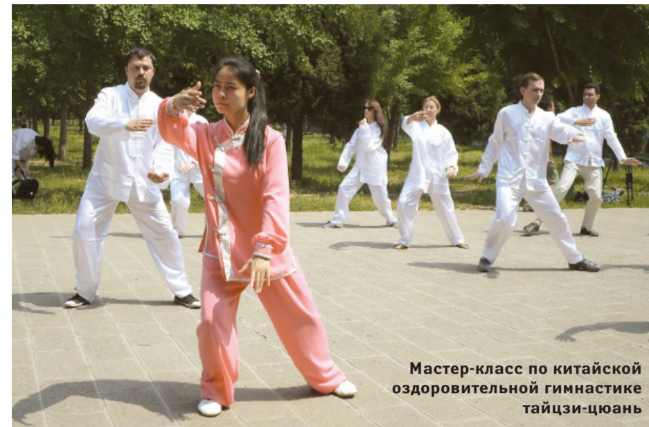
Мастер-класс по китайской оздоровительной гимнастике тайцзи-цюань

Последний день пребывания в Шаньдуне подарил нам незабываемый подъем на священную гору Тайшань в городе Тайань. Мы даже смирились с мыслью, что не удасться побывать на курорте этой провинции и искупаться в море. Почти до середины горы группу