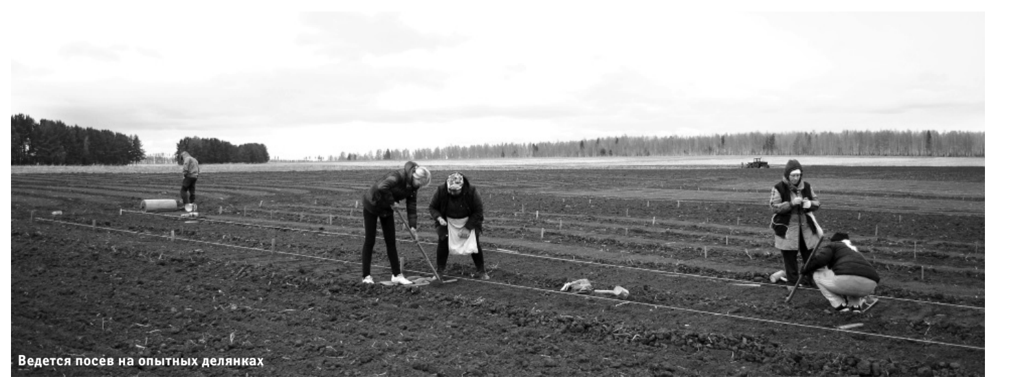
Ведется посев на опытных делянках