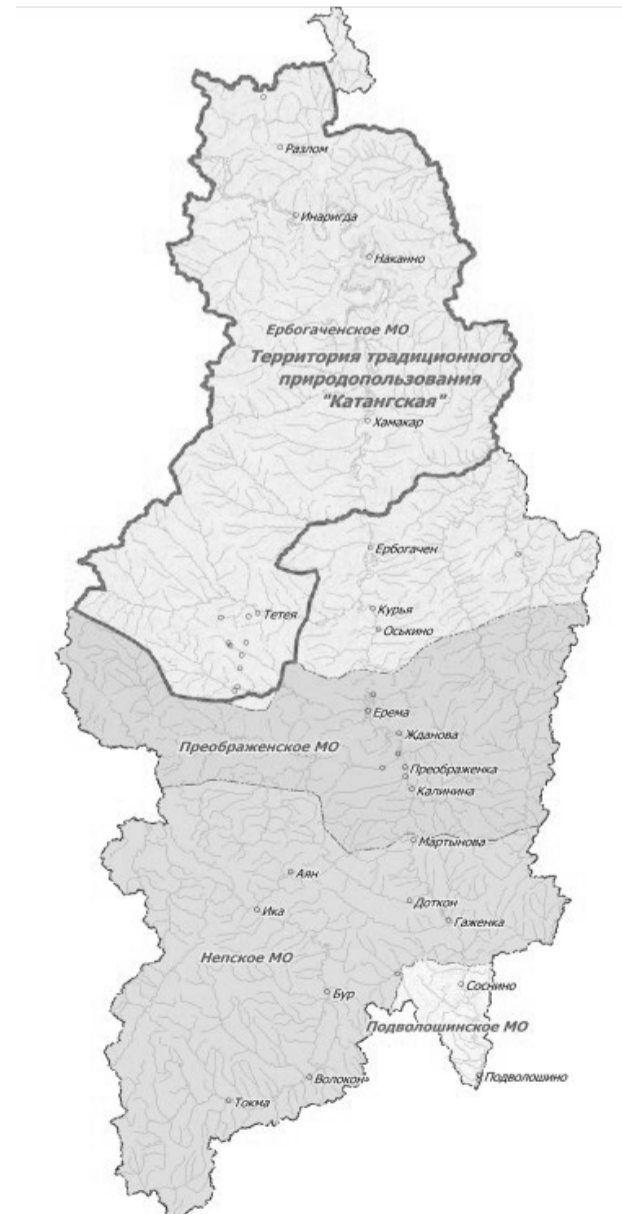
СХЕМА РАСПОЛОЖЕНИЯ ТЕРРИТОРИИ ТРАДИЦИОННОГО ПРИРОДОПОЛЬЗОВАНИЯ КОРЕННЫХ МАЛОЧИСЛЕННЫХ НАРОДОВ СЕВЕРА, СИБИРИ И ДАЛЬНЕГО ВОСТОКА РОССИЙСКОЙ ФЕДЕРАЦИИ, ПРОЖИВАЮЩИХ В ИРКУТСКОЙ ОБЛАСТИ, РЕГИОНАЛЬНОГО ЗНАЧЕНИЯ «КАТАНГСКАЯ», РАСПОЛОЖЕННОЙ НА ТЕРРИТОРИИ МУНИЦИПАЛЬНОГО ОБРАЗОВАНИЯ «КАТАНГСКИЙ РАЙОН»

Приложение к Положению о территории традиционного природопользования коренных малочисленных народов Севера, Сибири и Дальнего Востока Российской Федерации, проживающих в Иркутской области, регионального значения «Катангская», расположенной на территории муниципального образования «Катангский район»