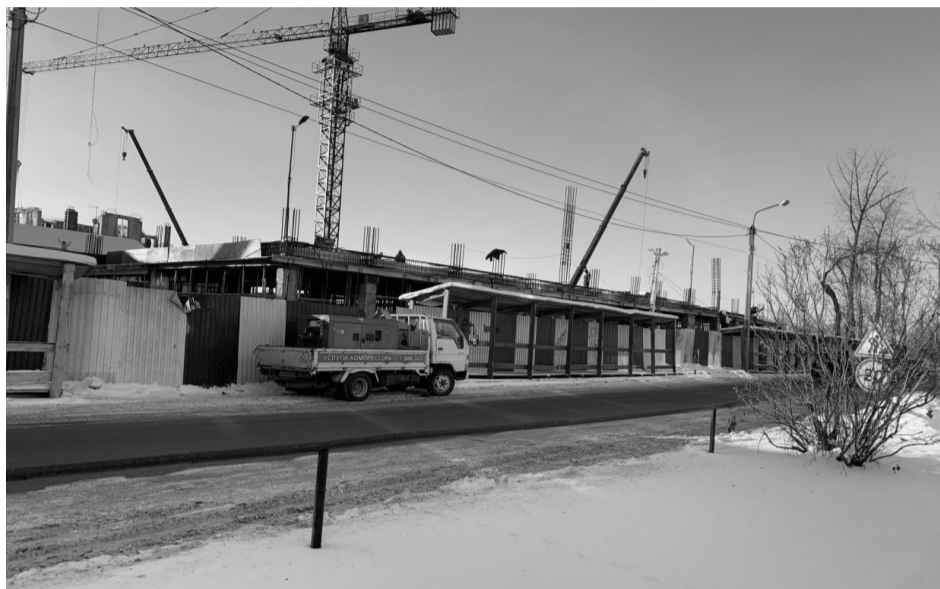
Общий вид с ул. Гаврилова.

Материалы фотофиксации объекта культурного наследия регионального значения: «Бани Курбатова и Русанова», 1870-е гг. расположенного по адресу: Иркутская область, г. Иркутск, ул. Гаврилова, 2.