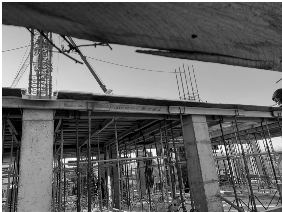
Возведение объекта культурного наследия с ул. Гаврилова.

<6> Указываются реквизиты документов, содержащих мнение собственника либо иного законного владельца объекта культурного наследия религиозного назначения и иные сведения, предусмотренные разделом V Порядка подготовки и утверждения охранного обязательства собственника или иного законного владельца объекта культурного наследия, включенного в единый государственный реестр объектов культурного наследия (памятников истории и культуры) народов Российской Федерации, утвержденного настоящим приказом.