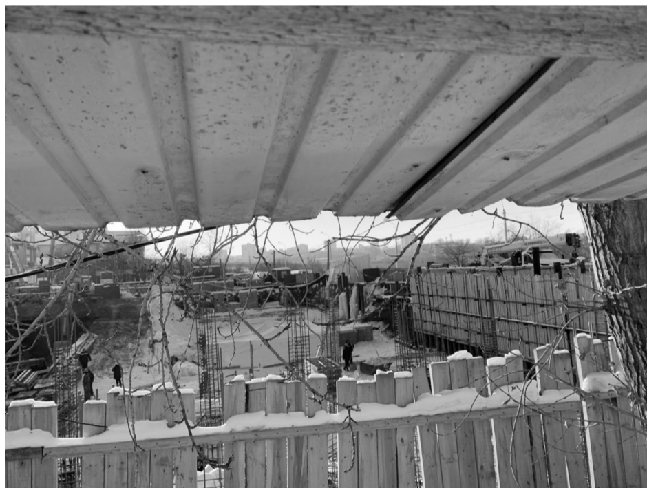
Возведение объекта культурного наследия с ул. Цесовской Набережной.