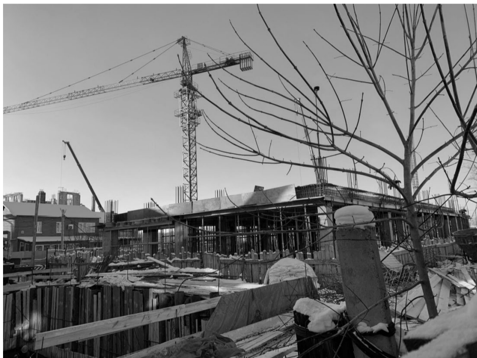
Возведение объекта культурного наследия с ул. Гаврилова.

<4> Указываются реквизиты документов, содержащих мнение собственника либо иного законного владельца объекта культурного наследия.