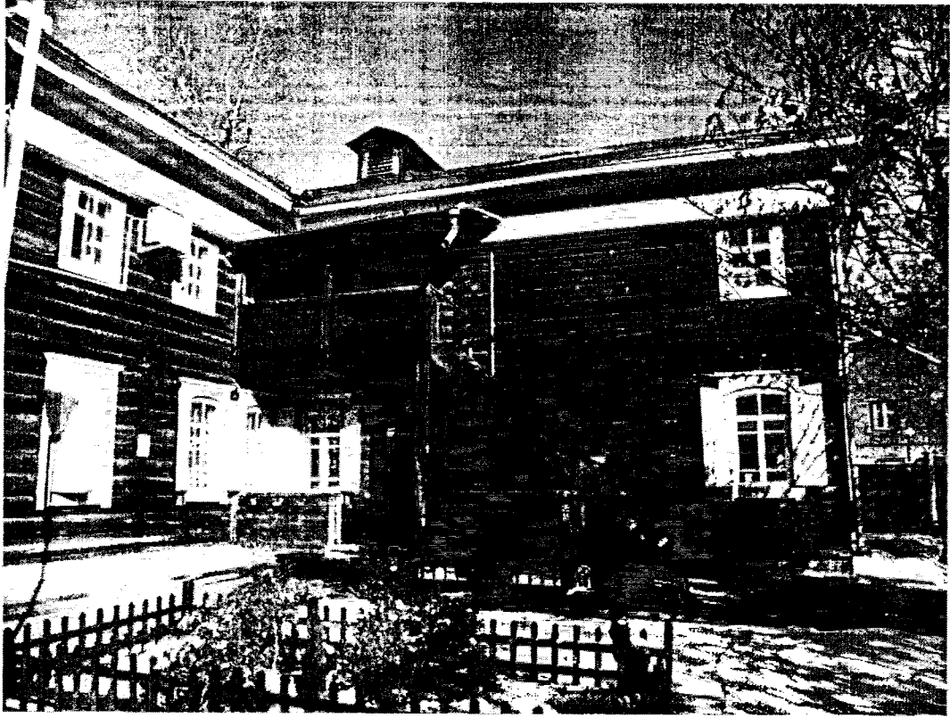
Фото 5 Общий вид со двора с юга