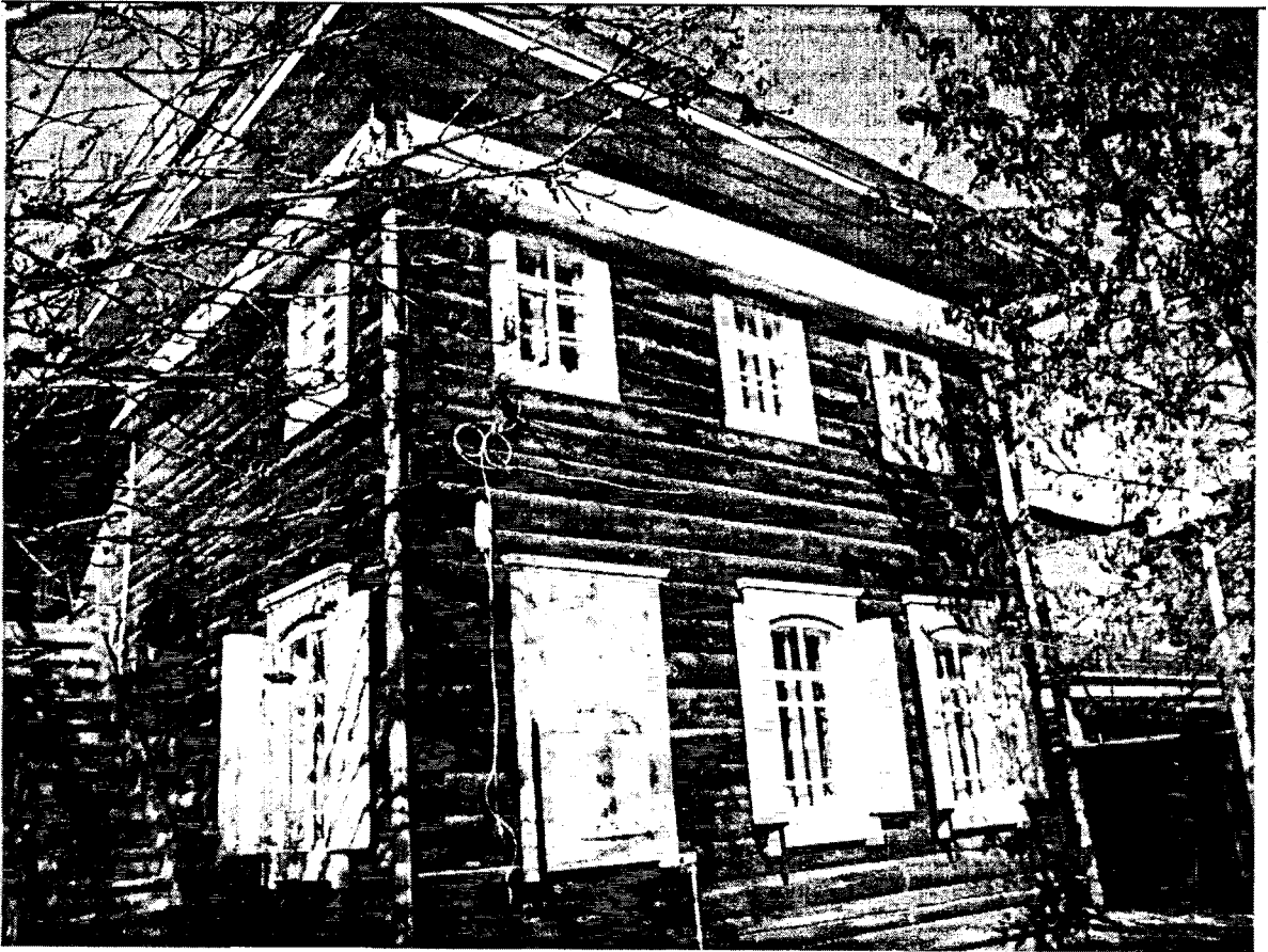
Фото 7 Дворовой юго-восточный фасад прируба