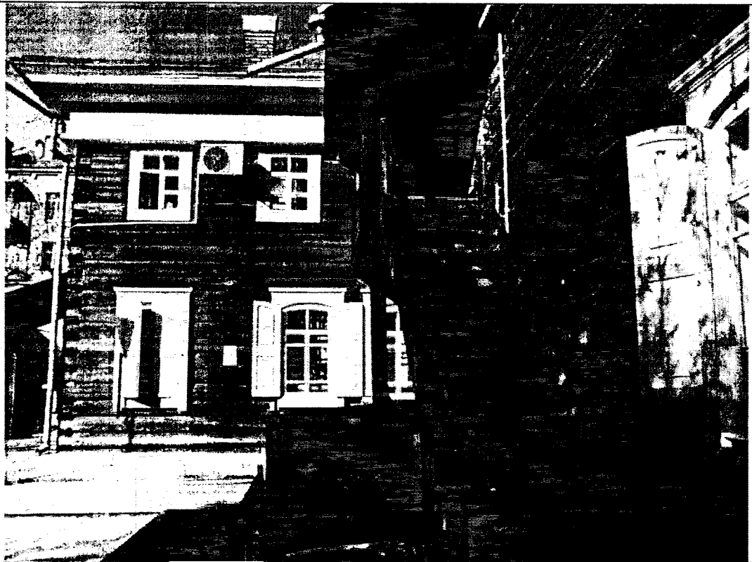
Фото 6 Дворовой юго-восточный фасад