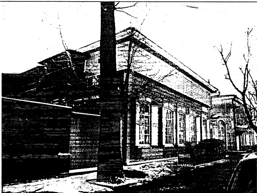
Фото 2 . Общий вид с ул. Свердлова с севера