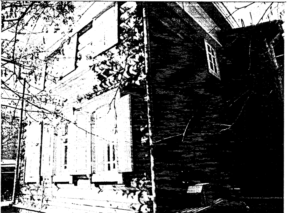
Фото 8 Вид со двора с востока