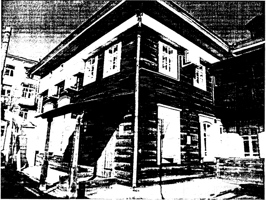
Фото 3 Общий вид со двора с юга