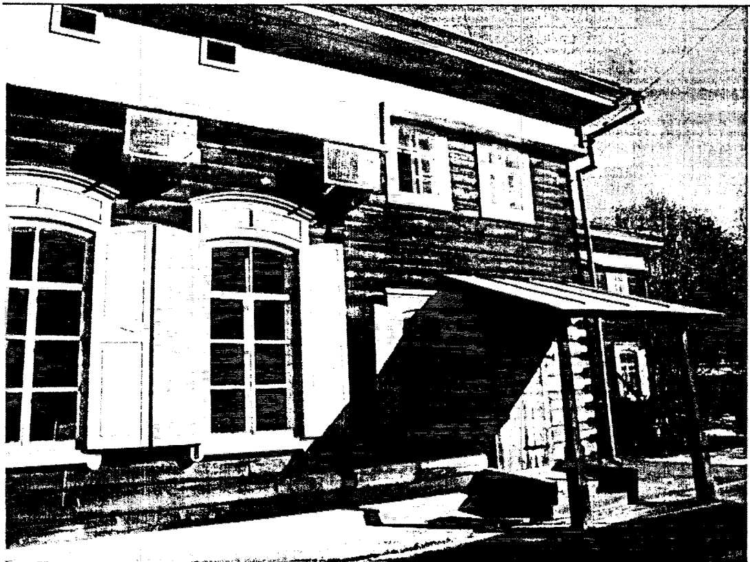
Фото 4 Боковой юго-западный фасад основного объема