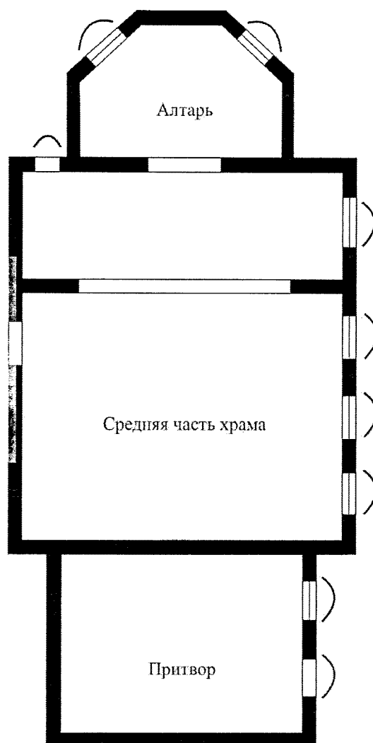
Схема обозначения предмета охраны в уровне 1 этажа