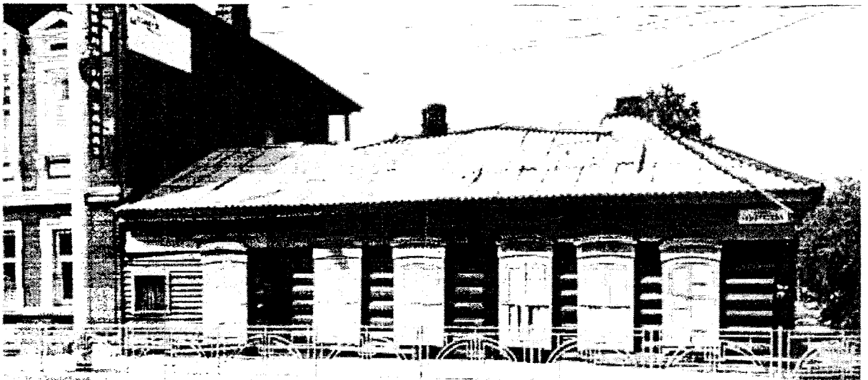
Фото 6 – Главный фасад дома с лавкой