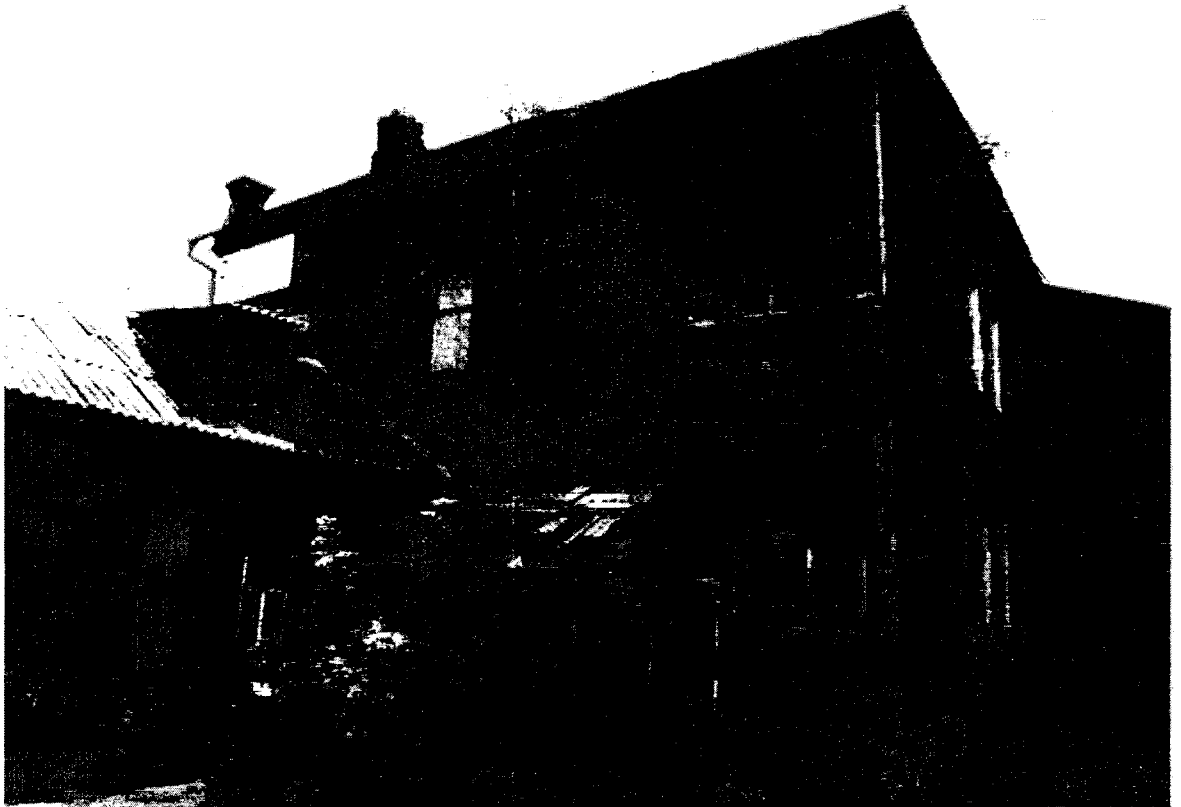
Фото 8 – Вид на элемент в составе усадьбы «Доходный дом» со стороны двора (с северного направления)