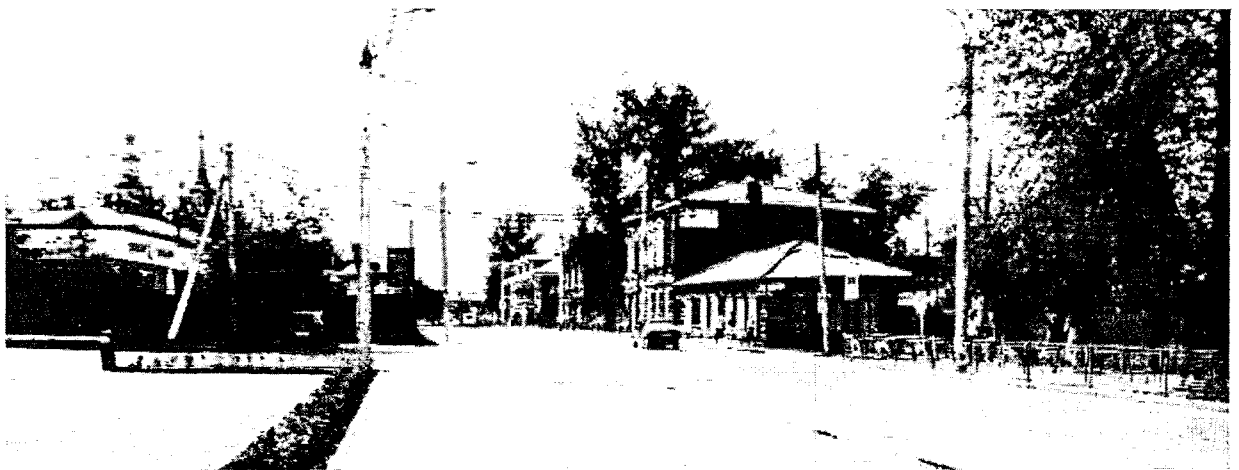
Фото 2 – Общий вид на усадьбу с северо-востока (в сторону перекрестка с ул. Грязнова)