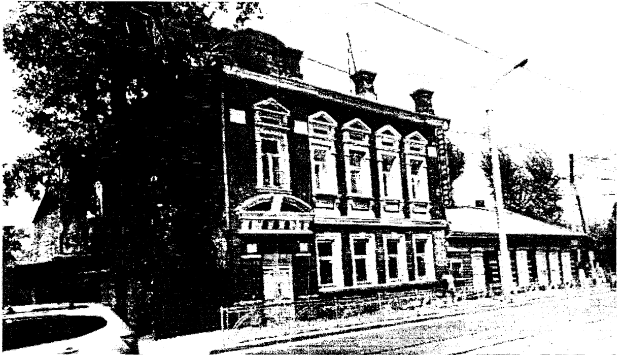
Фото 1 – Общий вид на усадьбу с юга. На переднем плане – элемент в составе усадьбы «доходный дом», на дальнем плане – «дом с лавкой»

Приложение к предмету охраны объекта культурного наследия регионального значения «Усадьба М.И. Кукса: дом с лавкой, доходный дом», кон. XIX - нач. XX вв., расположенного по адресу: Иркутская область, г. Иркутск, ул. Грязнова, 32, 32/1