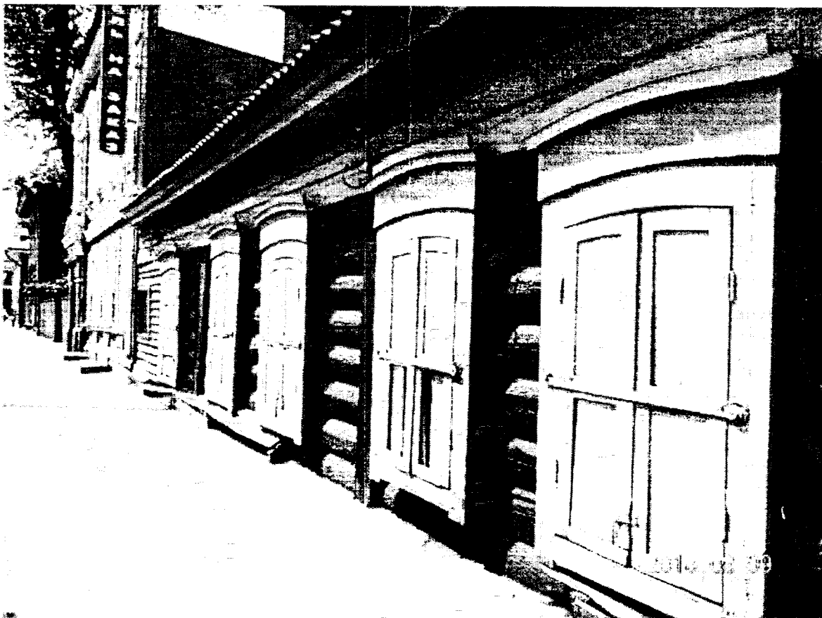
Фото 3 – Главный фасад элемента в составе усадьбе «Дом с лавкой»