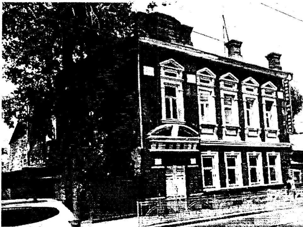
Фото 9 – Вид на элемент в составе усадьбы «Доходный дом» с юга. Главный юго-восточный, и боковой юго-западный фасады