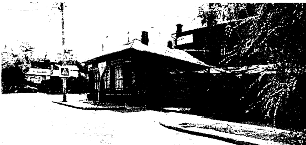
Фото 4 – Вид на дом с лавкой с севера