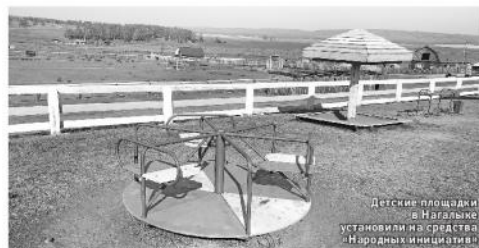
Детские площадки в Нагальке установили на средства «Народных инициатив»

В Нагальке проживают 800 человек. В местный санаторий постоянно приезжают отдыхающие. Так что новый парк будет востребован. Его строительство начнется в 2019 году. В работах задействуют молодежь, учителей, волонтеров. Парк разделит на несколько зон: для массовых мероприятий (летняя эстрада, кинозал под открытым небом, танцплощадка); для