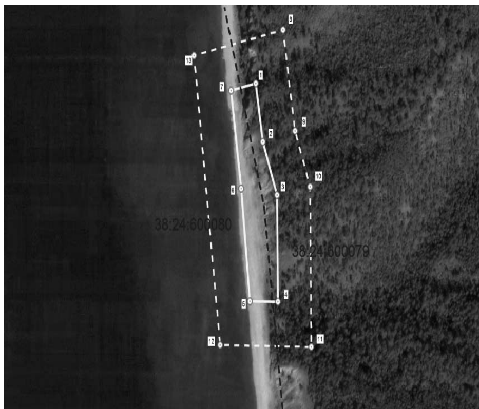
СХЕМА РАСПОЛОЖЕНИЯ ПАМЯТНИКА ПРИРОДЫ РЕГИОНАЛЬНОГО ЗНАЧЕНИЯ «ИСТОЧНИК СОЛЕННЫХ МИНЕРАЛЬНЫХ ВОД «ВОНЬКИЕ КЛЮЧИ»

Масштаб 1:5000 (в 1 см 50 м) Условные обозначения: